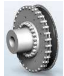
Acoplamiento para Buques de pasajeros (RATO R)

3. Buques de trabajo.- Bajo el término genérico de embarcaciones de trabajo se encuentran diversos tipos de embarcaciones tales como los arrastreros, remolcadores, buques de suministro en alta mar, buques de tripulación, buques de lucha contra incendios a través de los rompehielos y dragas. El denominador común entre todos estos tipos de buques es su operación sin cuartel perenne y salida continua sin restricciones, por lo que las unidades de accionamiento están sometidas a los mayores niveles de estrés y exigen una fiabilidad total. VULKAN ofrece la solución ideal para todas estas unidades de accionamiento exigentes: soporte del eje integral con VULKASTIK