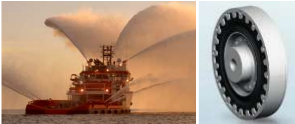
Acoplamientos para Buques de trabajo (VULKASTIK L)

L de acoplamiento, el acoplamiento VULKARDAN E para los motores montados elásticamente, así como el RATO probada R y acoplamientos RATO S para los motores de mayor potencia.