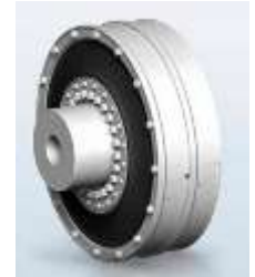
Acoplamiento para Buques de carga (familia RATO)

2. Buques de pasajeros.- Estos buques se caracterizan en particular por su comodidad, por lo que deben garantizar niveles bajos de vibración y ruido. Acoplamiento altamente flexibles RATO S, RATO S+ y RATO R, no sólo cumplen con estos requisitos, sino que se caracterizan por su potencial por absorber desalineamientos axiales altos, angulares y radiales.