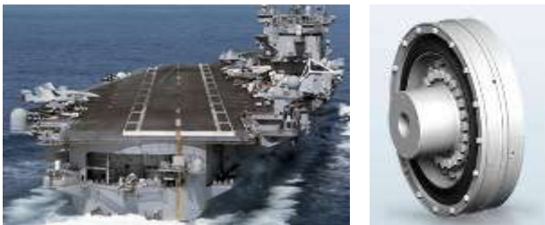
Acoplamientos para Buques especializados (RATO DG)

4. Buques especializados.- Los buques especializados son utilizados para cumplir diversas demandas. Mientras que los buques de carga pesada siguen el concepto de propulsión de los buques de carga, en las unidades de posicionamiento del motor eléctrico para FPSOs o plataformas de perforación (en su mayoría unidades verticales), el radial requerido y el axial guiado del tren de transmisión está garantizado por la más rígida configuración basada en la construcción del DG estándar de la línea de productos RATO.