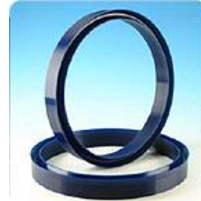
Resistencia a la compresión y abrasión