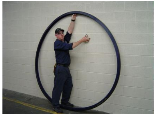
Variedad de dimensiones en Stock