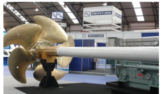
Alta protección contra la corrosión