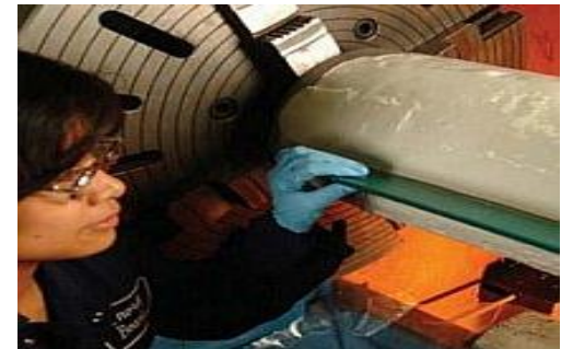
Alisado con paleta